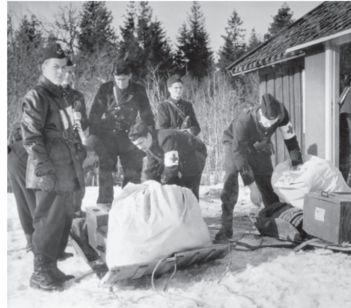
Sjukhuspersonal under förberedelse inför stridsövning.

Signalen: "Klart till strid!" har gått. Bårlagen göra sig klara för utryckning.