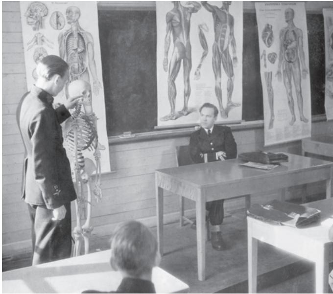
I skolsalen förhörs eleverna om skelettets uppbyggnad.