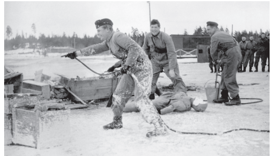
När planet fattar eld får eleverna öva brandsläckning.