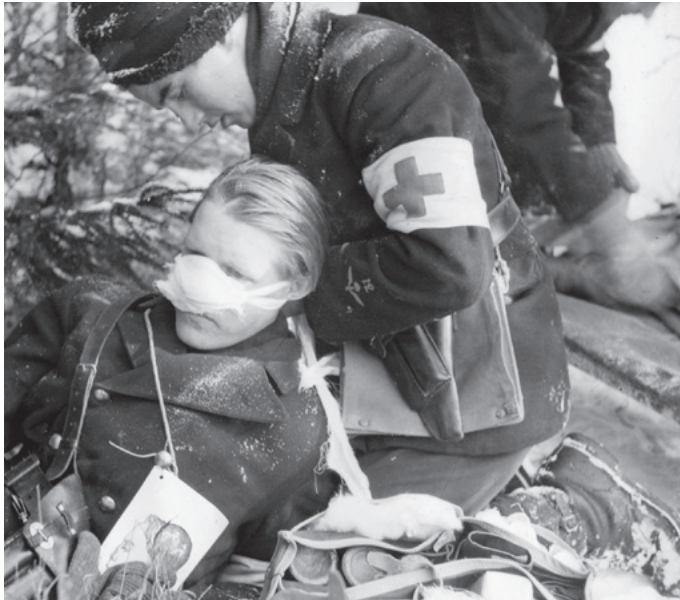
Första förband utförs på en av granatskärva bortsliten näsa.