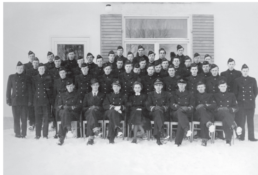
Skolans lärare och elever.

Föremålet för albumet benämnt Sjukvårdsskolan 15/1–15/3 1945 från F 11 verkar vara en tillfällig kurs i ämnet. Det finns inga uppgifter om att det gavs regelbundna kurser i sjukvård på F 11 så pass att benämningen ”skola” kan användas i egentlig betydelse. Av märkningen framgår att albumet har tillhört flottiljens sjukhus, kanske i dokumentärt syfte. Närmare ett 50-tal bilder presenterar bland annat sjukvårdsmateriel, första förband, förflyttning av skadad i fält och undervisning. Här visas ett urval.