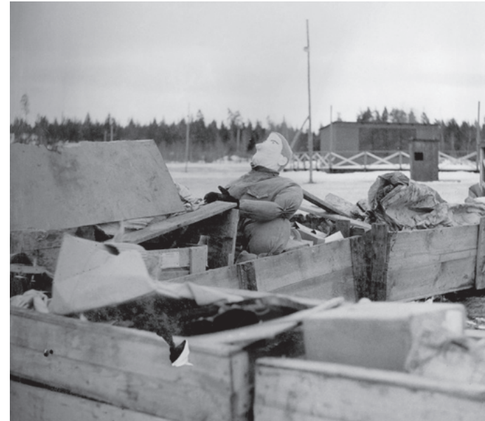
I ett störtat "flygplan" sitter "flygsoldaten Ove Rall von Dockan" fastklämd.