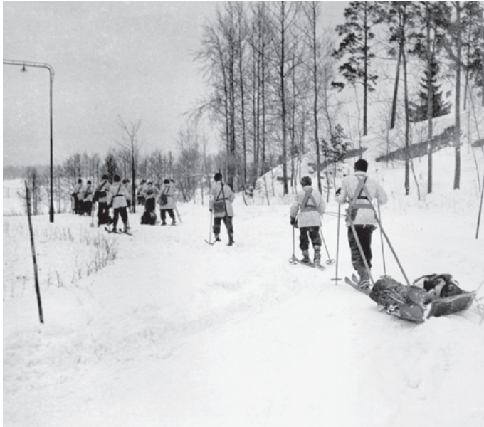
Ny övning stundar för sjukvårdsskolan, denna gång på skidor och med släpbårar.