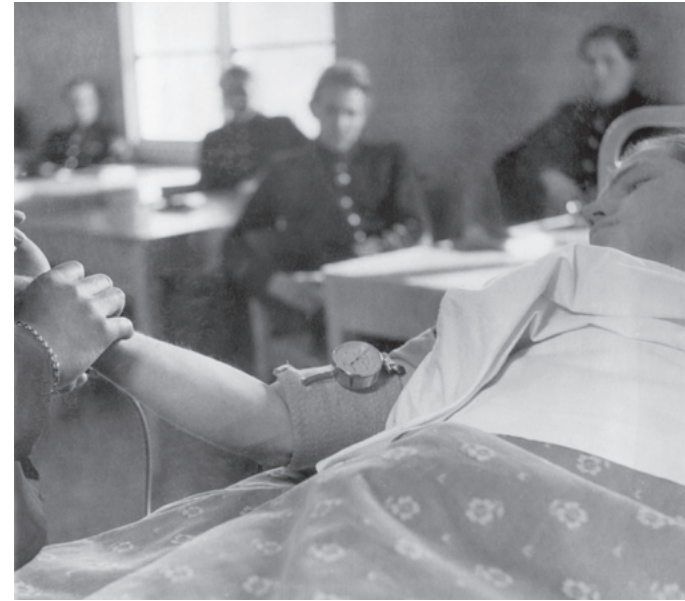
Hans blodtryck mäts ... ... och syrgas tillsätts.