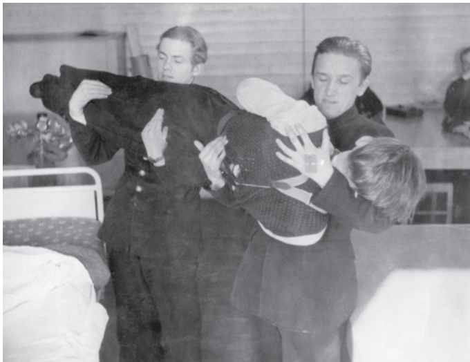
En drunknad tas om hand och lyfts försiktigt över från baren till sängen.