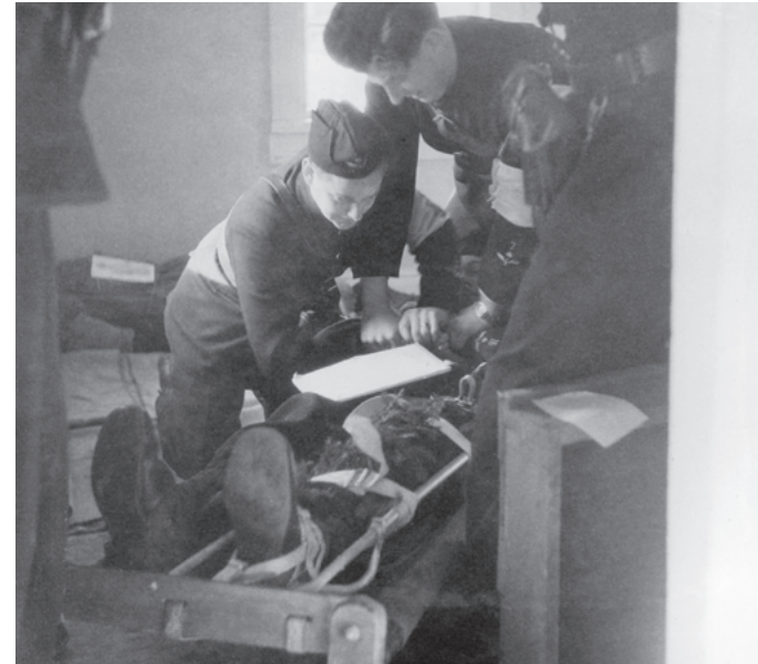
Väl inne i kvarteret förs anteckningar om den skadades tillstånd.