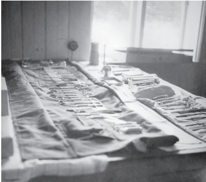
De kirurgiska instrumenten tillhörande "Utrustning större" har lagts fram för granskning.

Vinterväglag till trots tas cyklarna fram och utrustas med bärar innan avfärd till övningsplatsen.